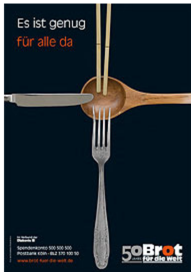
Plakat zur Aktion 2008 / 2009

Texte für den Vorstellungsgottesdienst am Sonntag Quasimodogeniti, den 11. April 2010, in der Evang.- luth. Kirche St.Maria zu Grasleben