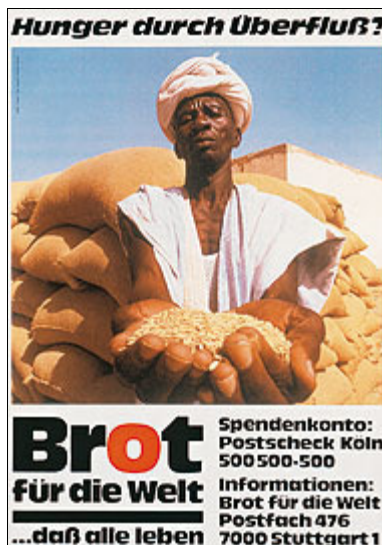
Plakat zur Aktion 1981 / 1982