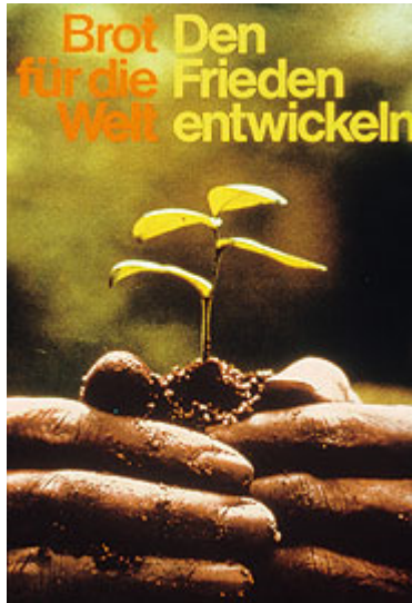
Plakat zur Aktion 1970 / 1971 / 1972

Das erste Plakat, das die Kleingruppe sich etwas genauer angeschaut hat, stammt aus den Jahren 1970 - 1972