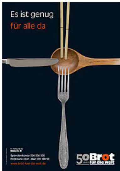
Plakat zur Aktion 2008 / 2009

Aus dem vorletzten Jahr stammt das Plakat mit dem Motto: „Es ist genug für alle da.“