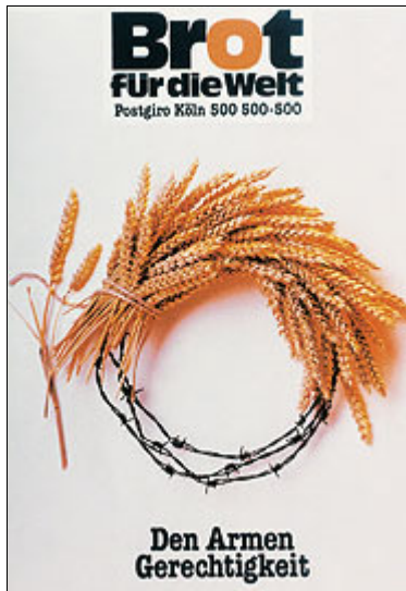
Plakat zur Aktion 1989 / 1990